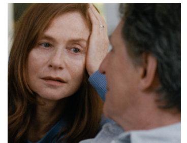
2015 LOUDER THAN BOMBS (Louder than Bombs) de Joachim Trier avec Isabelle Huppert