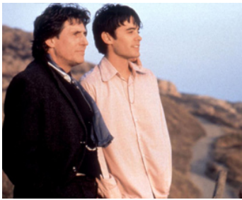
1996 THE LAST OF THE HIGH KINGS de David Keating avec Jared Leto