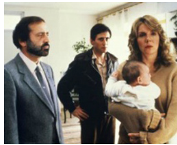
1983 HANNA K. (Hanna K.) de Costa-Gavras avec Jean Yanne, Jill Clayburgh