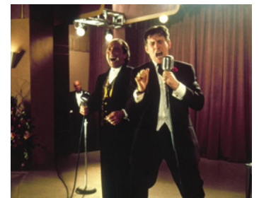
1996 MAD DOGS (Mad Dogs Time) de Larry Bishop avec Paul Anka