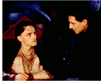
1987 CŒUR DE LION (Lionheart) de Franklin J. Schaffner avec Dexter Fletcher