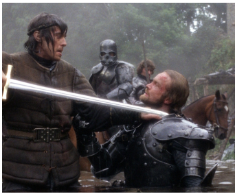
1981 EXCALIBUR (Excalibur) de John Boorman avec Nigel Terry