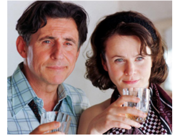
2005 WAH WAH (Wah Wah) de Richard E. Grant avec Emily Watson