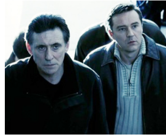
2005 ASSAUT SUR LE CENTRAL 13 (Assault on Precinct 13) de J.-Fr. Richet avec Currie Graham