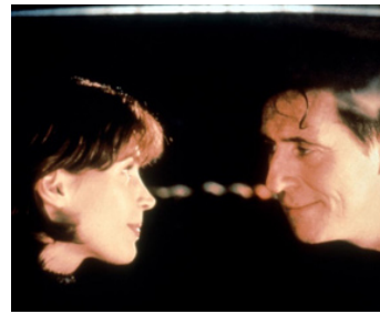
1997 SMILLA (Smilla's Sense of Snow) de Bille August avec Julia Ormond