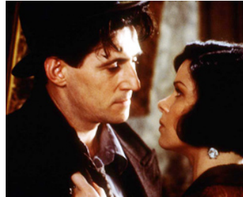
1990 MILLER'S CROSSING (Miller's Crossing) de Joel Coen avec Marcia Gay Harden