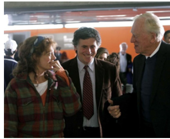
2007 EMOTIONAL ARITHMETIC de Paolo Barzman de Susan Sarandon, Max von Sydow