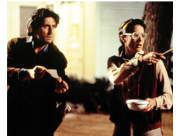
1993 UNE FEMME DANGEREUSE (A Dangerous Woman) de St. Gyllenhaal avec Debra Winger