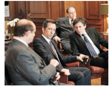
2012 LE CAPITAL de Costa-Gavras avec Gad Elmaleh