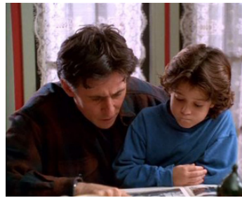
1996 SOMEBODY IS WAITING de Martin Donovan avec Tylor Cole Malingier