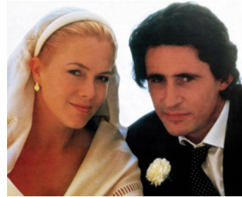
1987 JULIA ET JULIA (Giulia e Giulia) de Peter Del Monte avec Kathleen Turner