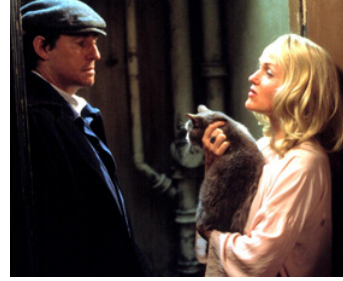
2002 SPIDER (Spider) de David Cronenberg avec Miranda Richardson