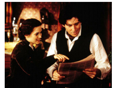
1994 LES 4 FILLES DU DR MARCH (Little Women) de Gilian Armstrong avec Winona Ryder