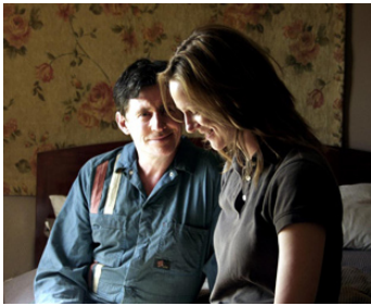
2006 JINDABYNE (Jindabyne) de Ray Lawrence avec Laura Linney