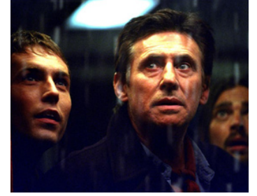
2002 LE VAISSEAU DE L'ANGOISSE (Ghost Ship) de Steve Beck avec Desmond Harrington