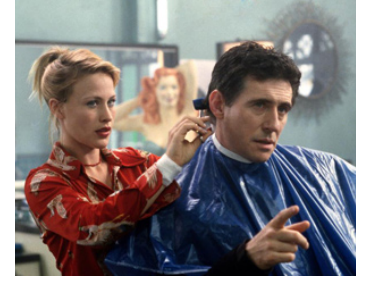
1999 STIGMATA (Stigmata) de Rupert Wainwright avec Patricia Arquette