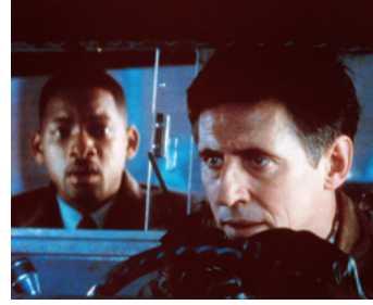
1998 ENNEMI D'ÉTAT (Enemy of the State) de Ridley Scott avec Tony Scott