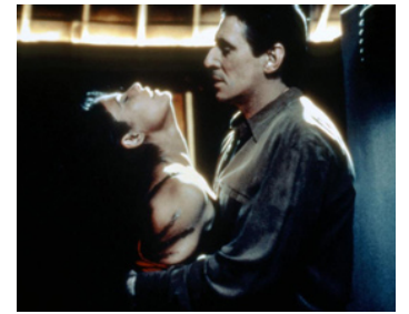
1997 THE END OF VIOLENCE de Wim Wenders avec Marisol Padilla Sanchez