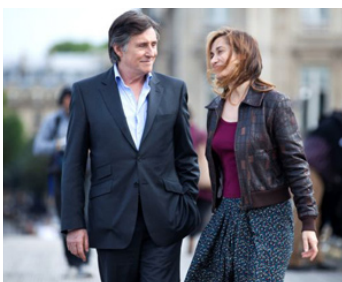
2013 LE TEMPS DE L'AVENTURE de Jérôme Bonnell avec Emmanuel Devos