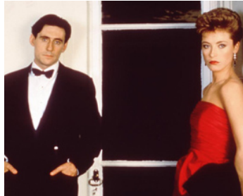
1989 DIAMOND SKULLS de Nick Broomfield avec Anna Donohoe