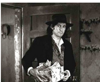
1995 DEAD MAN (Dead Man) de Jim Jarmush