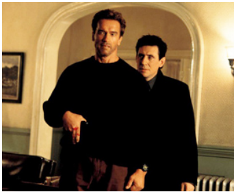
1999 LA FIN DES TEMPS (End of Days) de Peter Hyams avec Arnold Schwarzenegger