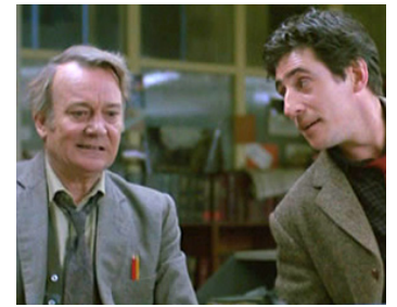
1985 DEFENCE OF THE REALM de David Drury avec Denholm Elliott