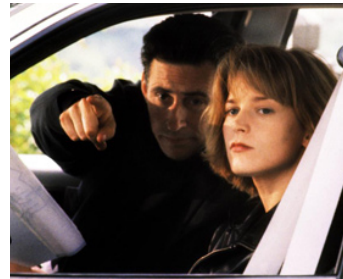
1993 NOM DE CODE: NINA (Point of no Return) de John Badham avec Bridget Fonda