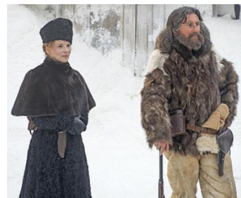
2015 PERSONNE N'ATTEND LA NUIT (Nadie quiere la noche) d'I. Coixet avec J. Binoche