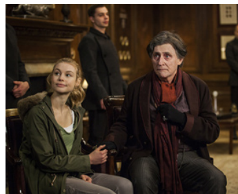
2014 VAMPIRE ACADEMY (Vampire Academy) de Mark Waters avec Lucy Fry