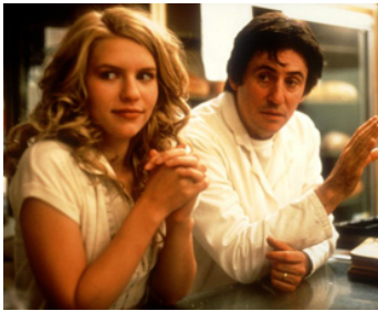
1998 POLISH WEDDING de Theresa Connelly avec Claire Danes