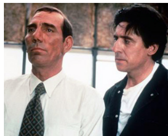
1995 USUAL SUSPECTS (The Usual Suspects) de Bryan Singer avec Peter Postlewaithe