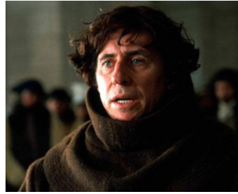
2004 LE PONT DU ROI SAINT LOUIS (The Bridge of San Luis Rey) de Mary McGuckian