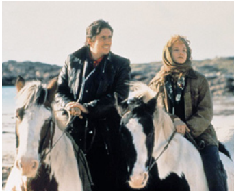
1992 LE CHEVAL VENU DE LA MER (Into the West) de Mike Newell avec Ellen Barkin