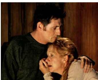
1994 LE PRINCE DE JUTLAND (Prince of Jutland) de Gabriel Axel avec Helen Mirren