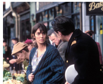
1995 FRANKIE STARLIGHT (Frankie Starligh) de Michael Lindsay-Hogg avec Anne Parillaud