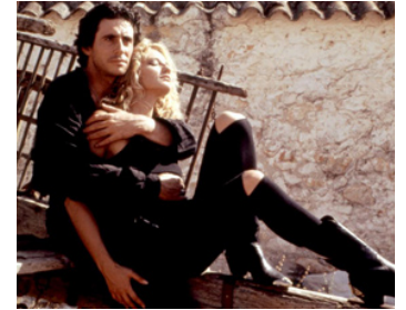
1987 SIESTA (Siesta) de Mary Lambert avec Ellen Barkin