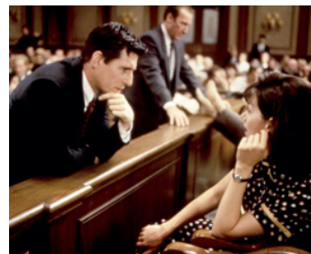
1994 LE DOUZIÈME JURÉ (Trial by Jury) de Heywood Gould avec Joanne Whalley-Kilmer