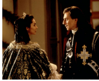
1998 L'HOMME AU MASQUE DE FER (The Man in the Iron Mask) de R. Wallace avec A. Parillaud