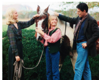
1994 LE CADEAU DU CIEL (A Simple Twist of Fate) de Gillies McKinnon avec Laura Linney