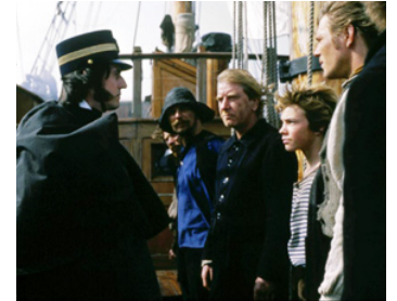
1990 LES NAUFRAGÉS DE L'ÎLE AUX PIRATES (Haakon Haakonsen) de Nils Gaup avec S. Smestad